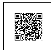
Zažádejte o vytyčení

Přílohy: Orientační zakres plynárenského zařízení, Detailní zakres plynárenského zařízení, Ověřená příloha žadatele